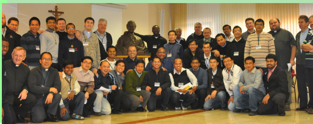
Účastníci prvého stretnutia saleziánskych misionárov v Európe - Pisana, 25-27. novembra 2011

Tak teda, ako môžem prispieť k Projektu Európa?